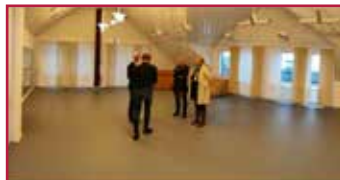
Viel Platz bietet der Ballettraum mit extra verlegtem Tanzboden.

Der Schlagzeugunterricht findet bis zur Fertigstellung der Schlagzeugräume im Sparkassengebäude voraussichtlich noch bis Anfang nächsten Jahres im Gebäude Schulstraße 7 statt.