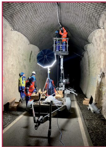
Auszubildende zum Elektriker für Betriebstechnik (Westnetz GmbH)